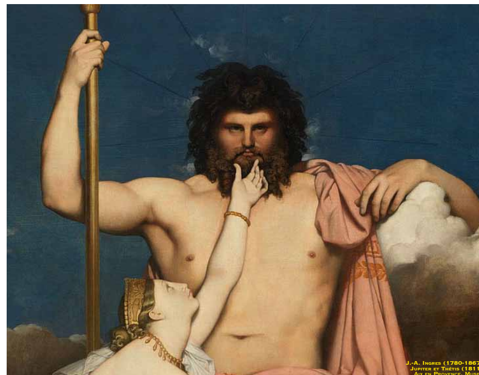
J.-A. Ingres (1780-1867) JUPITER ET THÉTIS (1811) AIX EN PROVENCE, MUSÉE GRANET (OIL ON TELA PAST)

SASSARI, VENERDÌ 16 APRILE, ORE 20 + TEATRO VERDI