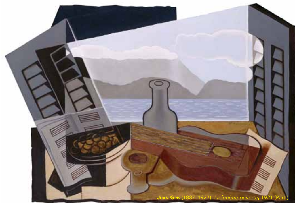
JUAN GRIS (1887–1927), La fenêtre ouverte , 1921 (Part.)

I MERCOLEDÌ DEL CONSERVATORIO RIPRENDERANNO NEL MESE DI FEBBRAIO 2024